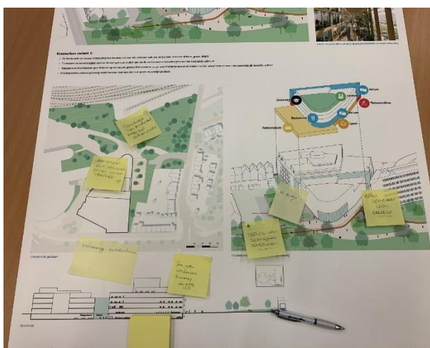
Paneel variant 1