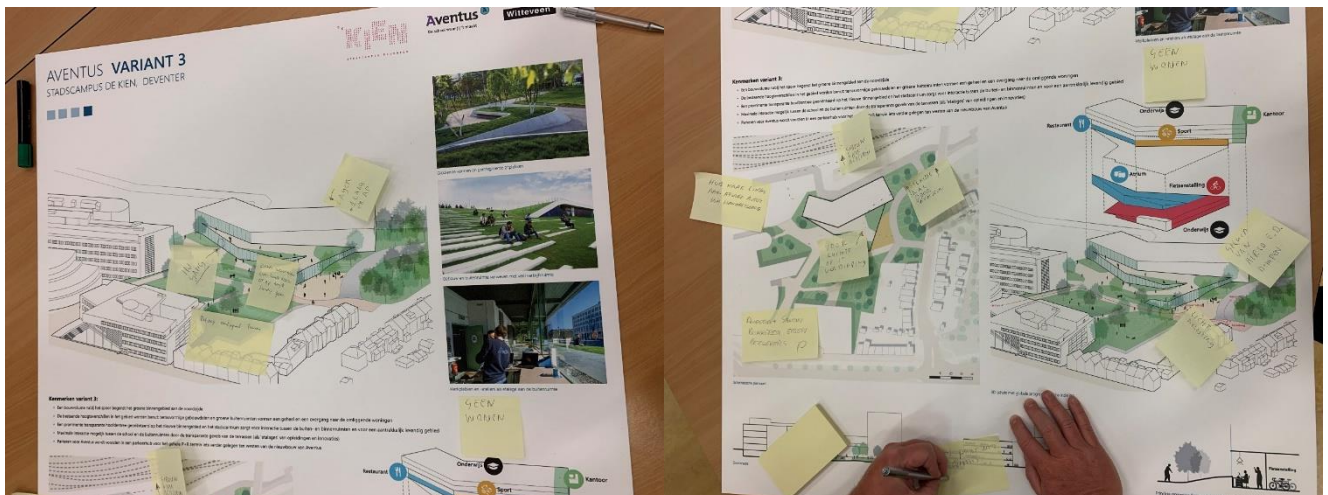
Paneel Variant 3