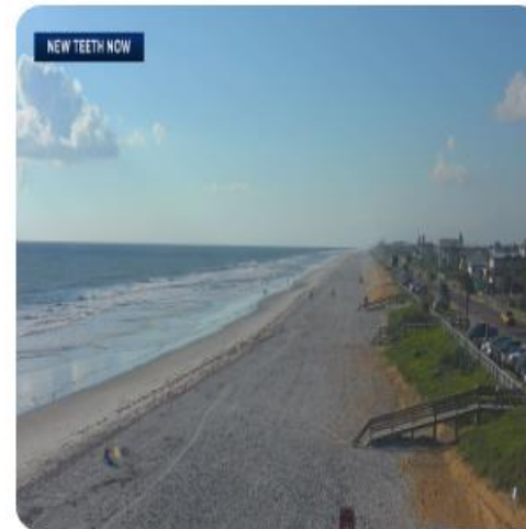
Live camera in Orlando, United States