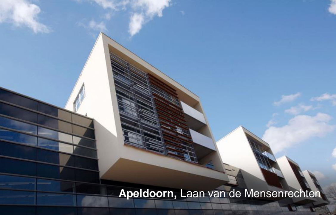
Apeldoorn, Laan van de Mensenrechten